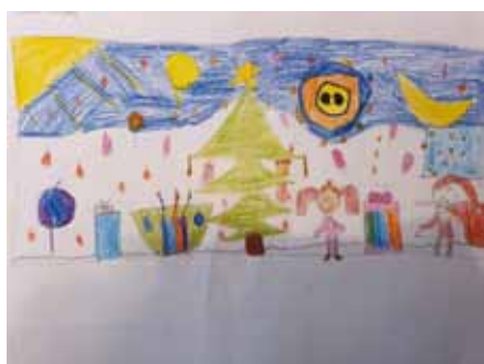
Ádám Tünde 3. osztály